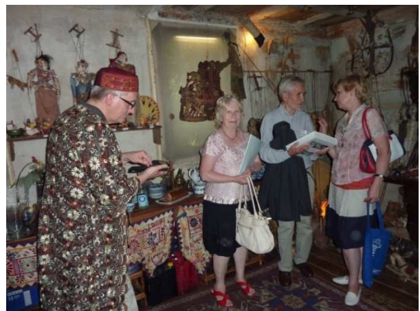
Zeit zum Staunen, Verkleiden und Gespräch im „Theater am Faden“